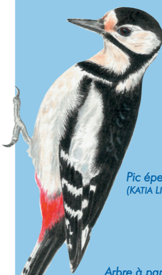
Pic épeiche.

Grille des montants alloués pour les arbres répondant au diamètre minimum éligible.