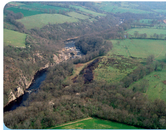
Vue aérienne des Portes d'Enfer sur la Gartempe.

Retrouvez l'actualité des sites Natura 2000 du Montmorillonnais sur : http://montmorillonnais.n2000.fr