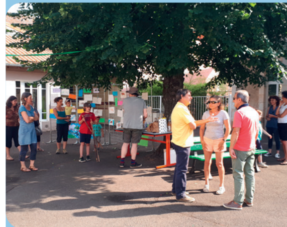
Exposition et pot convivial à Saulgé avant la sortie en famille sur les rives de la Gartempe.